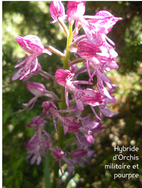
Hybride d'Orchis militaire et pourpre

Le COPAGE et la mairie de Barjac travaillent déjà à la préparation des contrats pour 2010, avec pour objectif d'assurer la préservation d'au moins 50% de la surface en habitats d'intérêt communautaire sur les deux sites.